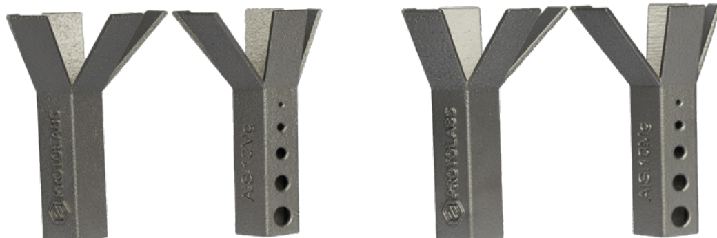
Alta risoluzione 30 µm