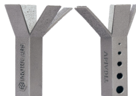
Risoluzione standard 60 µm