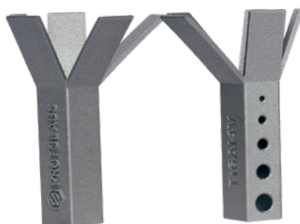
Alta risoluzione 30 µm