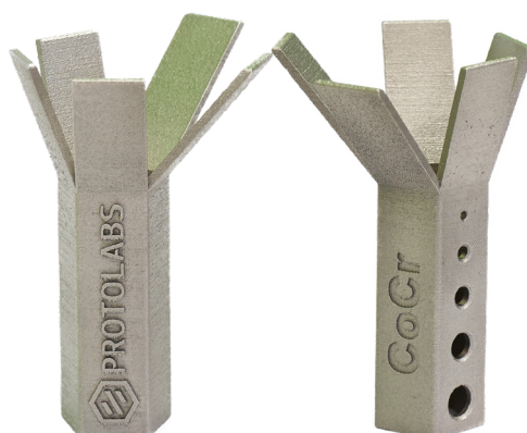
Micro Auflösung 20µm